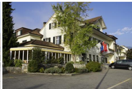
Haus zum Hirschen

Aus Qualitäts-Gründen müssen Sie sich auf ein Menu einigen, ausgenommen sind vegetarische und Intoleranz-Menüs.