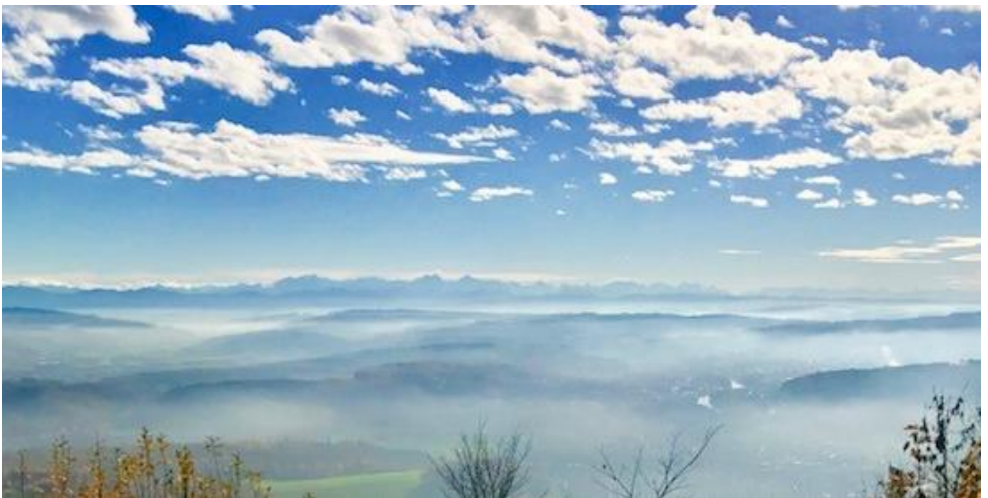
der Aargauer Jura oberhalb von Erlinsbach

Wir verwenden immer frische Produkte, wenn möglich aus der Region. Dort wo wir die Lebensmittel nicht in der gewünschten Qualität finden, greifen wir auf Produkte anderer Regionen zurück.