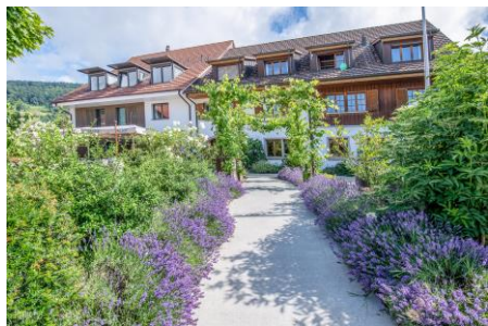
Weinhaus am Bach