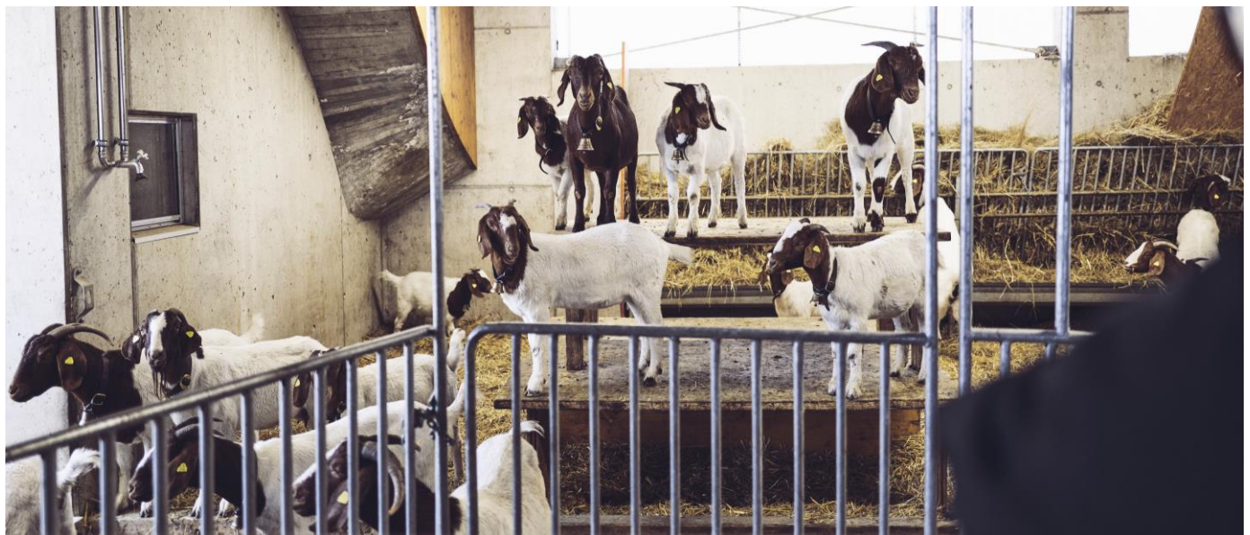
die vergnügten «Burenziegen» vom Hof Horn

Aus Qualitäts-Gründen müssen Sie sich auf ein Menu einigen, ausgenommen sind vegetarische und Intoleranz-Menüs.