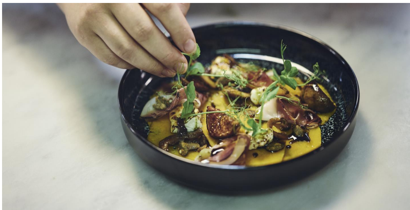
Vorspeise mit gelber Rande, Feige, Kerne und Jura Maischenrohschinken

Aus Qualitäts-Gründen müssen Sie sich auf ein Menu einigen, ausgenommen sind vegetarische und Intoleranz-Menüs.