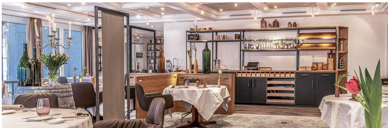
der Restaurantteil Zeitgeist