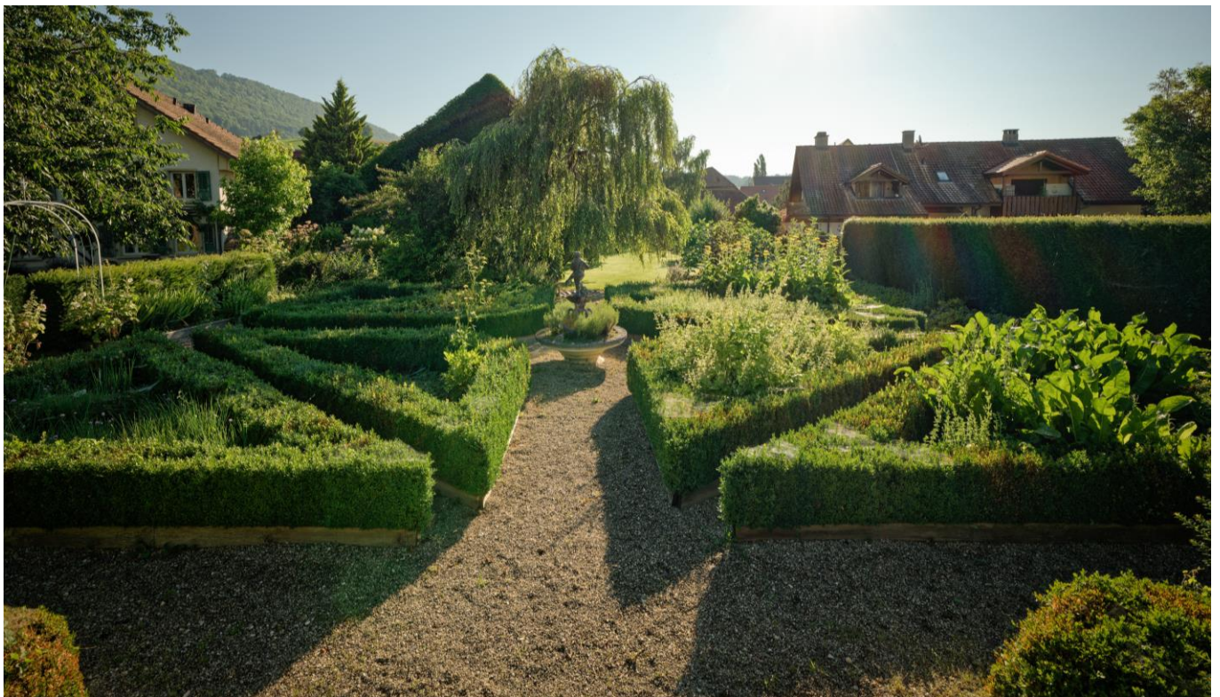
Blick über den Kräutergarten

Aus Qualitäts-Gründen müssen Sie sich auf ein Menu einigen, ausgenommen sind vegetarische und Intoleranz-Menüs.