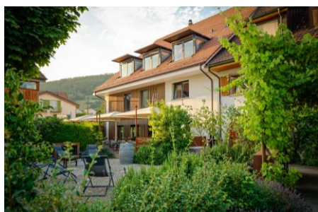
Weinhaus am Bach