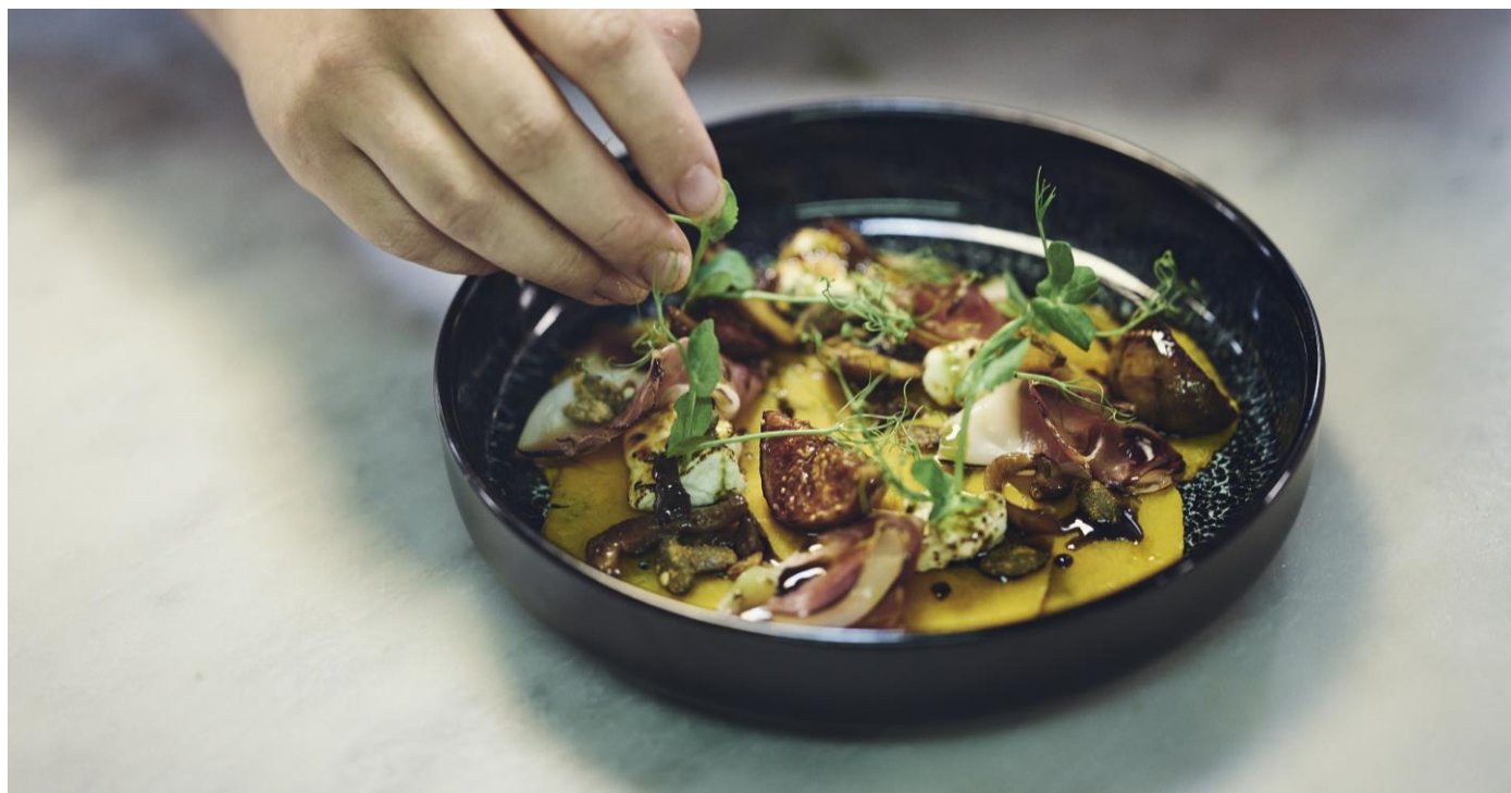
Vorspeise mit gelber Rande, Feige, Kerne und Jura Maischenrohschinken

Aus Qualitäts-Gründen müssen Sie sich auf ein Menu einigen, ausgenommen sind vegetarische und Intoleranz-Menus.