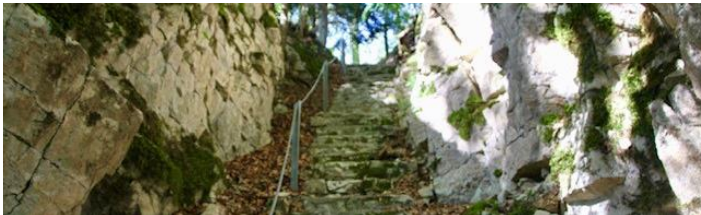
Himmels-Leiterli bei der Gälfluh oberhalb von Erlinsbach