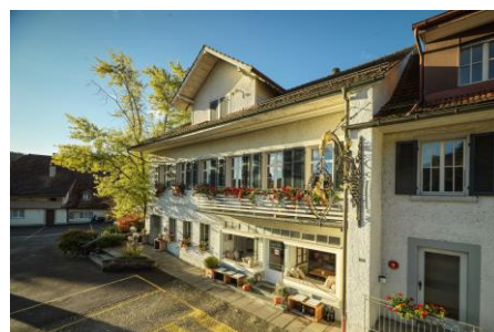
Haus zum Hirschen

Aus Qualitäts-Gründen müssen Sie sich auf ein Menu einigen, ausgenommen sind vegetarische und Intoleranz-Menüs.