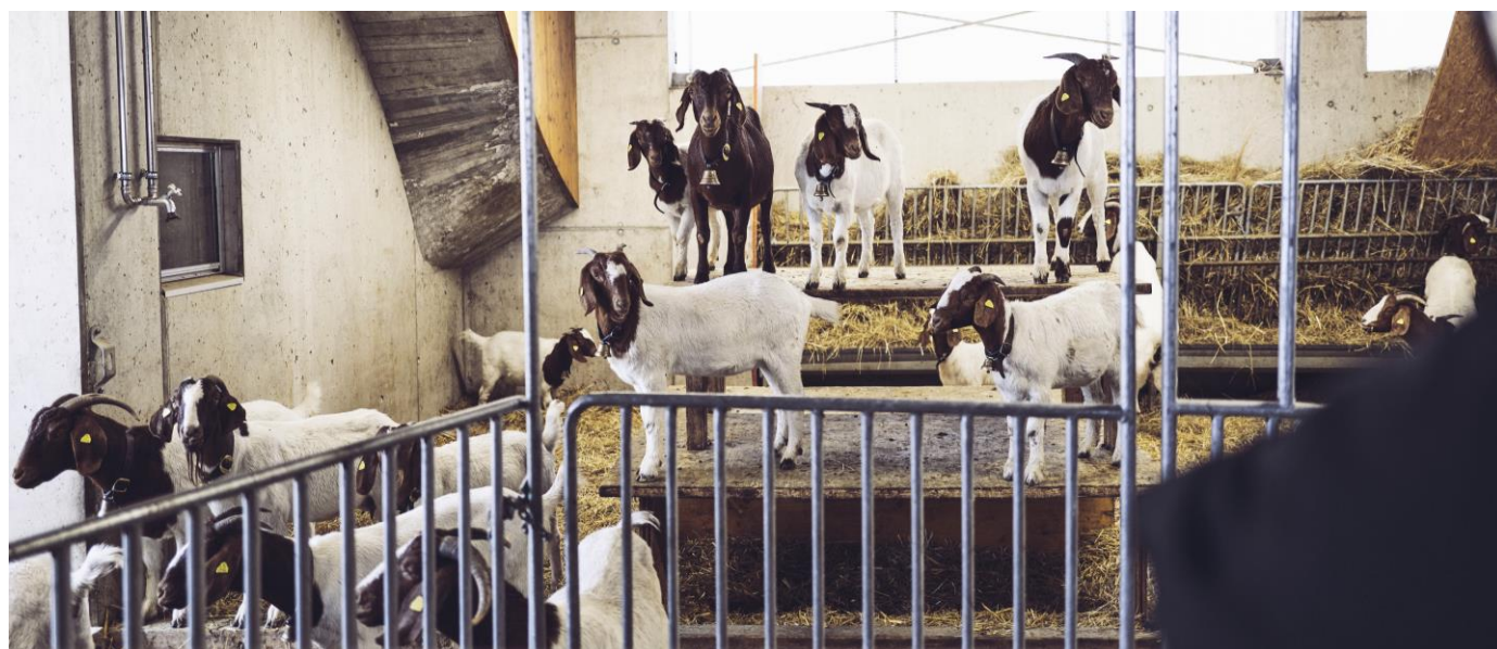
die vergnügten «Burenziegen» vom Hof Horn

Aus Qualitäts-Gründen müssen Sie sich auf ein Menu einigen, ausgenommen sind vegetarische und Intoleranz-Menüs.